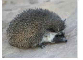
القنفذ طويل الاذنان

من اصغر انواع القناذف المعروفة بالاردن. يستطيع ان يتحمل المعيشة في مناطق جافة جداً ويقوم بعملية السبات لفترة تصل الى 40 يوم. يتغذى على عدد كبير من الحشرات وذوات المائة قدم والحلزونات الارضية. يتميز هذا النوع عن الانواع الاخرى من القناذف التي تعيش بالاردن بانه يستطيع ان يحفر جوره بنفسه بالإضافة الى انه يستخدم الفتحات العميقة تحت الصخور كماوى له.